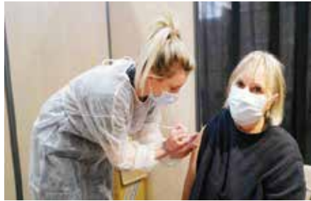
مسؤول أوروبي شبه إئتلاف مع الشركاء المصنعة للقاحات بمطبخ التسوق في «بارز».

وتابعوا «إذا استمر تطبيق هذا النظام، فسوف خلق ومقاومة تفاوتات كبيرة بين الدول الأعضاء بحلول الصيف، حيث سيتمكن البعض من الوصول إلى صناعة اللقاح في غضون أسابيع قليلة بينما سيشكل البعض الآخر كثيرا عن الركب».