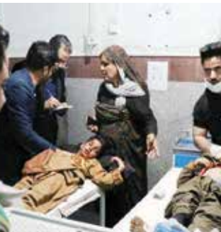
مطلان من المصابين في الهجوم بتفكيان العلاج بمستشفى في هرات.

وطلالان. لم تزل أي حجة حتى الآن مسؤولون عن اعتداء الجماع. وقال المتحدث باسم حركة طالبان نديم الحق: «مجاهد في تصريح لوكالة فرانس برس «لا دخل للمقاتلين» بالهجوم هرات». تحدثت حركة طالبان في إطار عملية