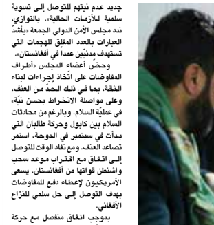
طلالان من المصابين في الهجوم بتفكيان العلاج بمستشفى في هرات.

وطلالان. لم تزل أي حجة حتى الآن مسؤولون عن اعتداء الجماع. وقال المتحدث باسم حركة طالبان نديم الحق: «مجاهد في تصريح لوكالة فرانس برس «لا دخل للمقاتلين» بالهجوم هرات». تحدثت حركة طالبان في إطار عملية