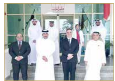
أعضاء لجنة التحقيق البرلمانية

سنبوا، وقلة عدد الأطباء في مجمع السلمانية الطبي، حيث يعاني الطبيب المختص 50 حالة مرضى سكلر يوميًا.