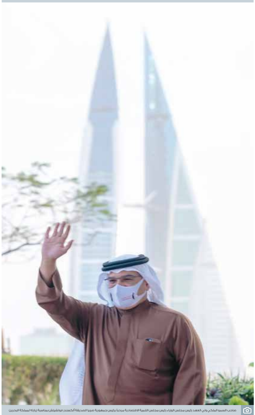
صاحب السمو الملكي والي العهد رئيس مجلس الوزراء رئيس مجلس التنمية الاقتصادية مرقيا برانس جمهورية صربيا الصديقة ألكسندر موشيتشيل بمناسبة زيارته لعمالة البحرين

رجاء «صمخوا شوي» فالتقرير الصادر من الاتحاد الأوروبي بداية مشاويرهم.