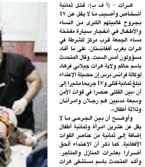
مطلان من المصابين في الهجوم بتفكيان العلاج بمستشفى في هرات.

وطلالان. لم تزل أي حجة حتى الآن مسؤولون عن اعتداء الجماع. وقال المتحدث باسم حركة طالبان نديم الحق: «مجاهد في تصريح لوكالة فرانس برس «لا دخل للمقاتلين» بالهجوم هرات». تحدثت حركة طالبان في إطار عملية