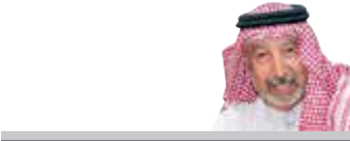
د. عبدالله يوسف المطوع

أشاد سمو الشيخ ناصر بن حمد آل خليفة ممثل جلالة الملك للأعمال الإنسانية وشؤون الشباب بدعم حضرة صاحب الجلالة الملك حمد بن عيسى آل خليفة الرئيس الفخري للمؤسسة الملكية للأعمال الإنسانية، واهتمام جلالاته بالعمل الخيري والإنساني داخل وخارج مملكة البحرين ومد يد العون للمحتاجين والمكويين، متمنياً سموه دعم الحكومة الرشيدة بقيادة صاحب السمو الملكي الأمير سلمان بن حمد آل خليفة ولي العهد الأمين رئيس مجلس الوزراء، كما أعرب سموه عن تقديره للإدارة التنفيذية وجميع موظفي المؤسسة الخيرية الملكية الذين أؤوا دوراً مميزاً في خدمة الأيتام والأرامل والمحتاجين داخل وخارج مملكة البحرين. مشيداً بمساهمة وعطاء الشعب البحريني الكريم في الأعمال الخيرية والإنسانية التي تنفذها المؤسسة.