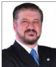
د. م. م. م. م.

يسهم كثيراً في الحد من المضاعفات لدى المصابين، ويسهل مسألة رصد قياسات مستوى السكر في الدم ومعالجتها تلقائياً وبصورة فورية، الأمر الذي يسهم في ممارسة المصابين بداء السكري لحياتهم بصورة طبيعية للغاية.